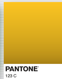
PANTONE 123 C