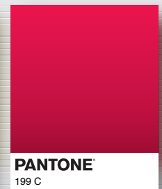
PANTONE 199 C