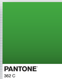
PANTONE 362 C