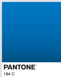
PANTONE 184 C